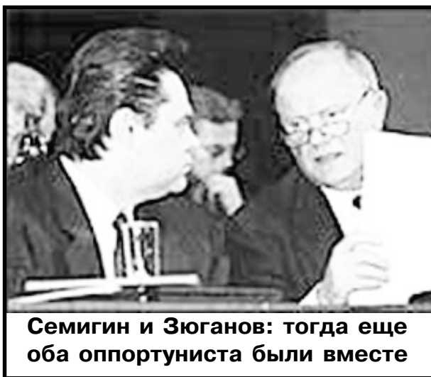
Семигин и Зюганов: тогда еще оба оппортуниста были вместе

Гуманность социалистических и коммунистических отношений, от которых по глупости отказалась значительная часть бывшего советского общества основывалась прежде всего на отсутствии частной собственности на средства производства, землю, природные ресурсы и жилой фонд. Плановое ведение хозяйства и государственная монополия исключали безработицу в СССР и