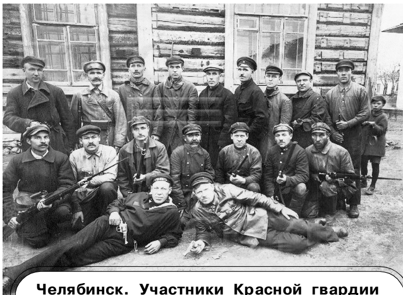
Челябинск. Участники Красной гвардии железнодорожного района. 1918 г.

защитой своих, доверявших им начальников. Надо было или упразднить весь институт, оставив власть слепой и беззащитной в атмосфере, насыщенной шпионством, брожением, изменой, большевистской агитацией и организованной работой разложения, или же совершенно изменить бытовой материал, комплектовавший контрразведку. Генерал-квартирмейстер штаба, ведавший в порядке надзора контрразведывательными органами армий, настоятельно советовал привлечь на эту службу бывший жандармский корпус. Я на это не пошел и решил оздоровить больной институт, влив в него новую струю в лице чинов судебного ведомства. К сожалению, практически это можно было осуществить только тогда, когда отступление армий подняло волны беженства и вызвало наплыв