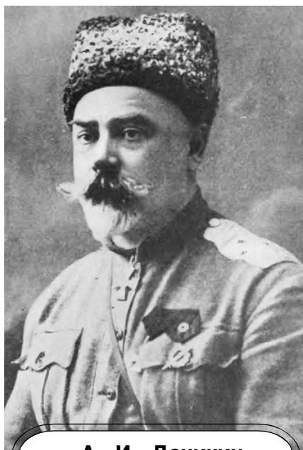
А. И. Деникин