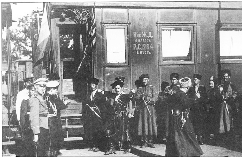
Личный конвой командующего Добровольческой армией у штабного вагона генерала В.Май-Маевского

летарием, и буржуем. Все требовали от власти защиты своих прав и интересов, но очень немногие склонны были оказать ей реальную помощь. Особенно странной была эта черта в отношении большинства буржуазии к той власти, которая воссоставляла буржуазный строй