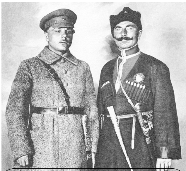
К. Е. Ворошилов и С. М. Будённый

Лишь оздоровление народного хозяйства могло очистить его от паразитов. Но для этого кроме всех прочих условий нужно было время.