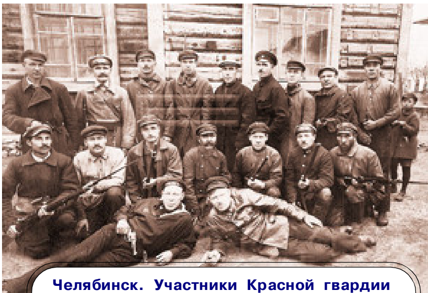
Челябинск. Участники Красной гвардии железнодорожного района. 1918 г.

ритории Юга, были иногда очагами провокации и организованного грабежа. Особенно прославились в этом отношении контрразведки Киева, Харькова, Одессы, Ростова (донская). Борьба с ними шла одновременно