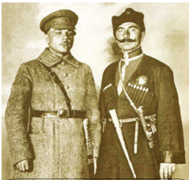
К. Е. Ворошилов и С. М. Будённый

крупным и солидным торговым организациям...» Но и этот способ возбуждал в нас известное сомнение, принимая во внимание ту суровую самокритику, которую вынесли сами представители класса: «...совещание считает своим долгом указать на угрожающее падение нравственного уровня во всех профессиях, соприкасающихся с промышленностью и торговлей. Падение это охватило ныне все круги этих профессий и выражается в непомерном росте спекуляции, в