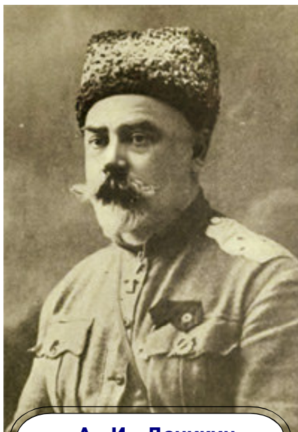
А. И. Деникин