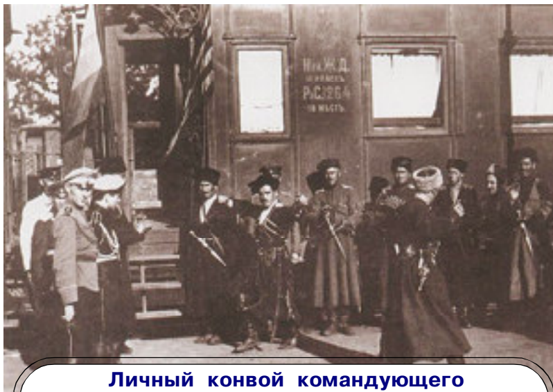
Личный конвой командующего Добровольческой армией у штабного вагона генерала В.Май-Маевского

Долго ждали мы прибытия видного сановника — одного из немногих, вынесших с пожара старую бюрократии репутацию передового человека. Предположено было привлечь его в Особое совещание. Прибыв в Екатеринодар, при