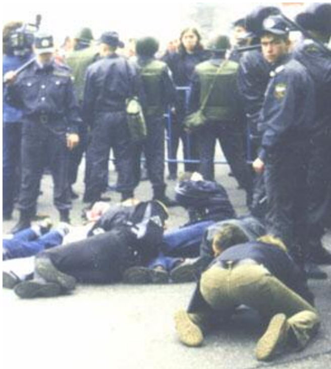
Так обычно заканчиваются «очень радикальные», но пустые акции. 15 сентября 2002 года. «Антикапитализм - 2002»