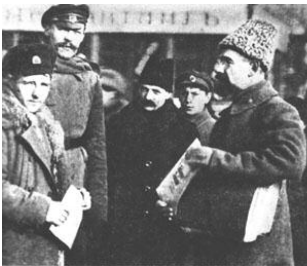
А. В. Луначарский агитирует солдат. Весна 1917 г.

рода выступала как составная часть политической армии революции. Практика показала, что её формирование и успех в борьбе возможны только в обстановке революционного кризиса, при поддержке всей политической армии революции , поднимающейся на борьбу против гнёта капитала. Вне этих условий, без этой поддержки вооруженная сила превращается в орудие путчизма и неизбежно обречена на поражение . Это ярко было подтверждено и во второй половине XX века на опыте Португалии и