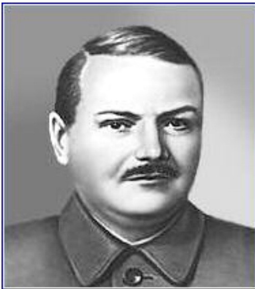
А. А. Жданов

Таким образом, вместо борьбы за мобилизацию и укрепление революционного сознания пролетариата на стадии подготовки социалистической револю-