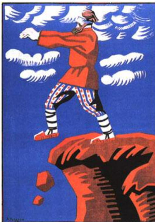
НЕГРАМОТНЫЙ ТОТ-ЖЕ СЛЕПОЙ ВСЮДУ ЕГО ЖДУТ НЕУДАЧИ И НЕСЧАСТЬЯ.