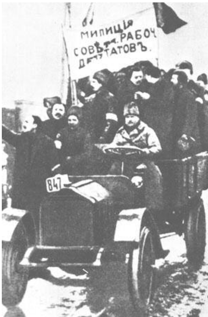
Милиция Совета рабочих депутатов

В ряде работ, написанных в 1905 - 1907 гг., Ленин обосновал вывод: чем скорее пролетариат вооружится, тем скорее дрогнет царское войско, тем большее количество солдат откажется от роли слепого орудия в руках царского самодержавия. Он призывал удесятерить большевистскую агитацию в массах, органи-