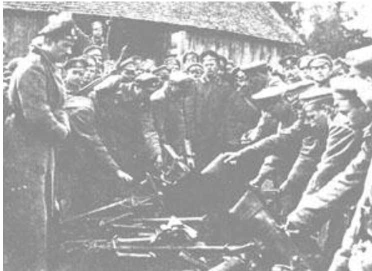
Разоружение корниловцев. Август 1917 года.

обходима как для победоносного вооружённого восстания, так и для обеспечения мирного развития революции. При этом её главной задачей должна была стать защита завоеваний революции от агрессии со стороны международного империализма . В своё время даже такой апологет монархизма, как знаменитый русский историк Н.М. Карамзин, отмечал: «Нет свободы, когда нет силы защитить её». Дело в том, что после утраты власти господствующие классы неизбежно стремятся к вооружённой реставрации старых порядков. Поэтому после свержения самодержавия, подчёркивал Ленин, «потребуется гигантское напряжение революционной энергии всех передовых классов, чтобы отстоять это завоевание». Без наличия революционной армии решить эту задачу невозможно.