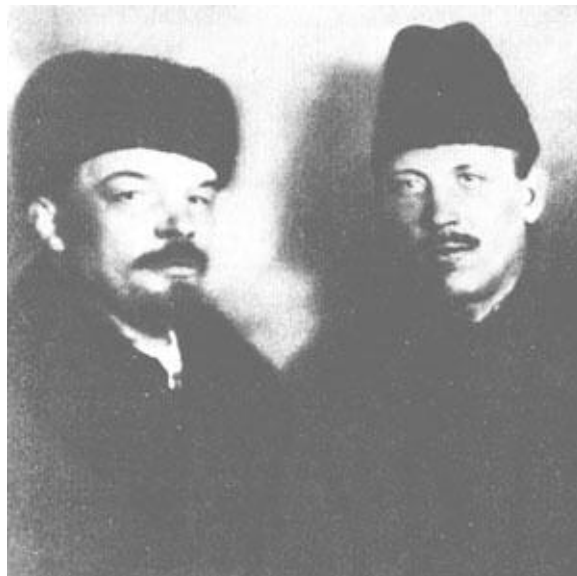
В. И. Ленин и Демьян Бедный

Так как капиталистическое общество находится в упадке, как то, которое существует в Великобритании в настоящее время, эстетически позитивное социалистическое произведение искусства, в общем, вызывает негативный психологический отклик у представителей капиталистического класса, оно кажется им некрасивым. Более того, оно находится в остром противоречии с общепризнанными канона-