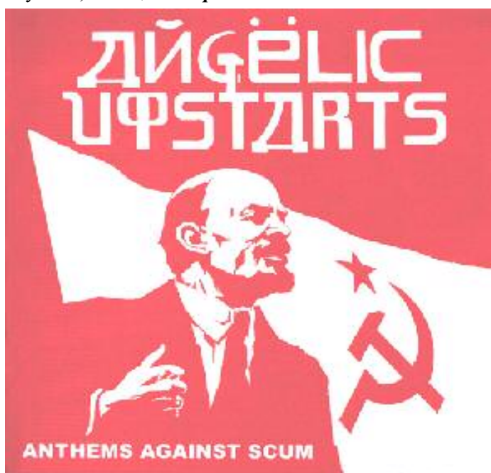
Обложка одного из альбомов группы «Angelic Upstarts»

Но плачевное состояние современной левой культуры в бывшем СССР объясняется еще и тем, что одним из идейных фронтов, на котором коммунисты потерпели полное и сокрушительное поражение, был художественный фронт. Творческая интеллигенция - даже та, которая не приемлет того, что происходит сейчас - практически поголовно отвернулась от них, и коммунисты сдали позиции, то есть не смогли до