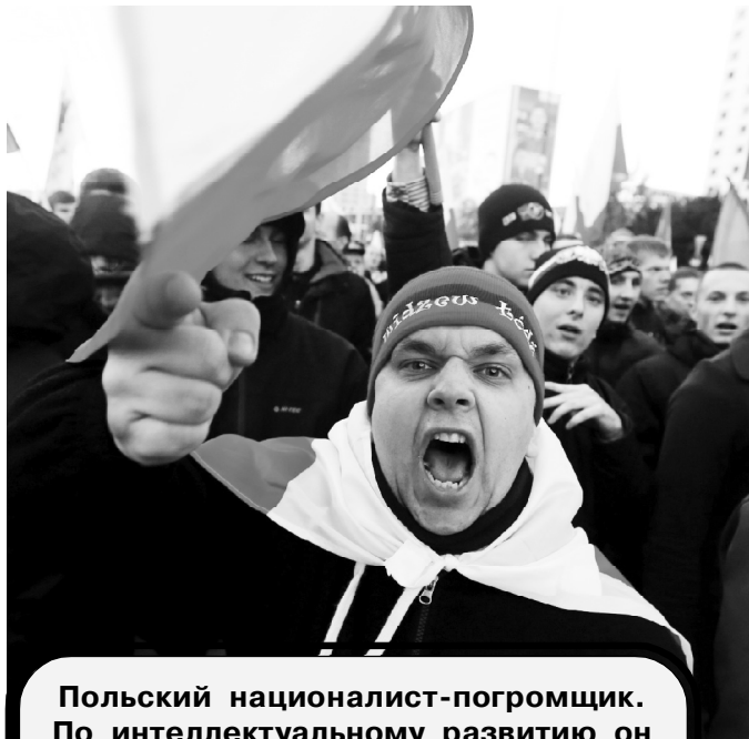
Польский националист-погромщик. По интеллектуальному развитию он мало отличается от любого другого националиста.

Многие командиры украинских батальонов, кровью своих молодых подчиненных, уже завоевали себе право заседать в единственном надёжном отапливаемом и освещенном помещении в Киеве, а рядовые молодые националисты будут продолжать мерзнуть и погибать в окопах под ДНР. Таков замысел и путь каждого крупного националиста вверх по карьерной лестнице из костей желто-