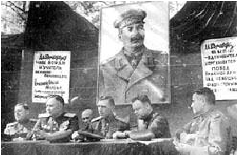
Митинг в освобожденном населенном пункте. 1943 год

Вчитываясь в те или иные пассажи пишущих о войне, становится жалко читателя - ибо в нагромождениях разного рода чепухи, написанной либо от конъюнктуры, либо от невежества, либо от лютой озлобленности против Советской власти, либо от всего этого вместе, - трудно докопаться