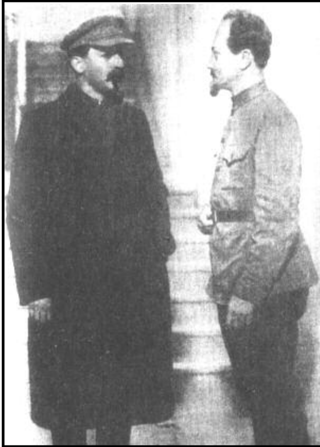
Сталин и Дзержинский. 1919 год