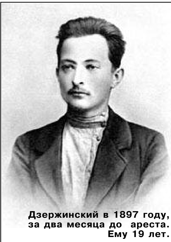
Дзержинский в 1897 году, за два месяца до ареста. Ему 19 лет.

Оказывается, и в те времена было немало несознательных людей, не готовых к борьбе. Но Дзержинский, да и все большевики, не сидели сложа руки в ожидании, когда массы созреют и сами начнут искать тех кто всё знает, чтоб встать на путь истинный. Большевики прекрасно понимали, что сами по себе трудящиеся массы не могут обрести коммунистического сознания. Оно им может быть привнесено только извне. Своими собственными силами рабочий класс в состоянии выработать лишь сознание тред-юнионистское, а, значит, мелкобуржуазное, то есть, бороться только за свои ближайшие интересы: рабочий день, зарплата, условия труда и т.д.