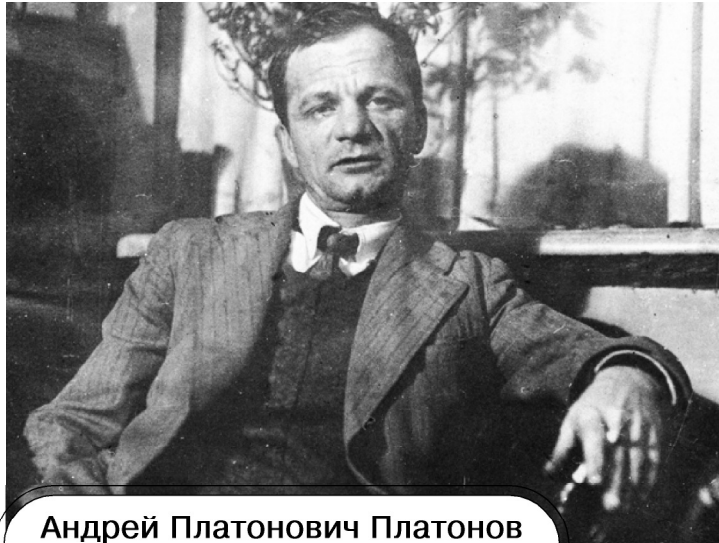
Андрей Платонович Платонов (настоящая фамилия Климентов; 16 августа 1899 - 5 января 1951) - русский советский писатель, поэт, публицист, драматург, сценарист, журналист, военный корреспондент и инженер.

в частную собственность равные доли земли, была убога]. Но христианская форма «коммунизма» веками топталась на месте и даже отползала все дальше и дальше от коммунистического содержания, пока не выхолостила от него почти всё, ос- в и в