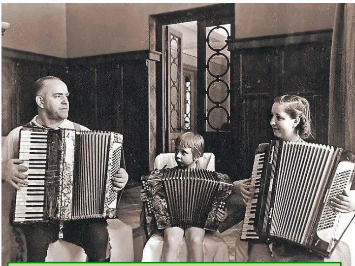
Жуков с семьёй и трофейными аккордеонами. С другим барахлом он почему-то не фотографировался

Метров 500–600 было куплено фланели и обоевого шелку для обивки мебели и различных штор, т.к. дача, которую я получил во временное пользование от госбезопасности, не имела оборудования. Кроме того, т. Властик просил меня купить для какого-то особого объекта метров 500. Но так как Властик был снят с работы, этот материал остался лежать на даче. Мне сказали, что на даче и в других местах обнаружено более 4 тысяч метров различной мануфактуры, я такой цифры не знаю. Прошу разрешить составить акт фактическому состоянию. Я считаю это неверным. Картины и ковры, а также люстры действительно были взяты в брошен-